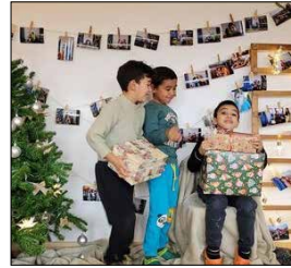
Rumänische Kinder freuen sich über Geschenke vom DOMUS-Verein

Wenn man die Diskussionen in den Medien verfolgt, hat man den Eindruck, unser ganzes Land ist ein altes Haus, vor dem die Handwerker mit dem Hauswirt stehen und ihm beibringen: „ Eigentlich muss hier alles neu gemacht werden. “ Renten, Pflege, Bundeswehr, Schulen, Krankenhäuser, Brücken, Bahnstrecken. Nichts scheint mehr in Ordnung oder durch kleine Maßnahmen reparierbar zu sein. Alles müsste eigentlich neu gemacht werden. Über die Ursachen und die notwendigen Maßnahmen lässt sich schwer Einigung erzielen, selbst innerhalb von Parteien. Vielleicht haben wir hier in Deutschland oder im gesamten Westen zu lange in der Illusion gelebt, die Welt und unser Leben auf ihr müssten immer besser werden, alle Probleme ließen sich mit gutem Willen lösen, und wer die richtige Einstellung hat, müsste automatisch auch alles richtig machen. Dabei ist unsere Welt viel zu komplex, die Schicksale der Menschen viel zu unterschiedlich und das Böse eine zu große Macht, als dass irgendein Politiker, irgendeine Partei, irgendeine Ideologie, irgendeine Zeit alles zum Guten wenden könnten. Im Gegenteil, je besser das Rechtssystem ausgebaut ist, umso stärker sehen die Menschen die verbleibende Ungerechtigkeit. Je umfassender die Menschen abgesichert sind, umso deutlicher nehmen sie die verbleibenden