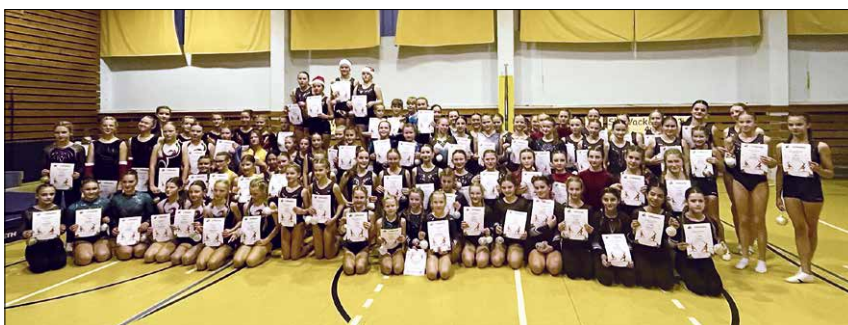
Synchronturnerinnen 2. Durchgang

Dieses Jahr mussten unsere Pflichtmädels als Sonderaufgabe Sit-ups mit Medizinball