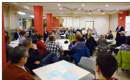
Teilnehmer beim Lichtenauer Wirtschaftsforum

Freuen Sie sich auf spannende Impulse und die Gelegenheit zum Austausch mit Expertinnen und Experten.