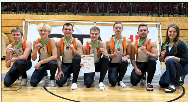
Sächsische Mannschaftsmeisterschaften Herren, Foto: Claudia Meister