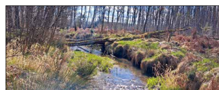
Ein naturnahes Gewässer mit unterschiedlichem Bewuchs bietet eine große Vielfalt für Lebewesen, aber auch zur Erholung.

Ein naturnahes Gewässer besteht also nicht aus einem kurz gemähten Böschungsrasen und ist auch nicht begradigt. Doch innerorts gibt es dafür nicht immer genug Platz. Deshalb muss gelegentlich gemäht werden und an bestimmten Stellen ist eine Gehölzpflege erforderlich. Insbesondere, wenn das Hochwasser sonst keinen Platz mehr hat und zur Gefahr werden kann. Wichtig ist dann aber, dass die Pflege schonend erfolgt, beispielsweise durch ein abschnittswises vorgehen. Schließlich sollen durch Mahd und Gehölzschnitt die vielen